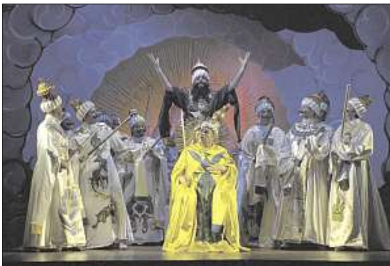
Monsieur Jourdain, élevé au rang fantaisiste de Grand Mamamouchi...

► Le Bourgeois gentilhomme , les 30 et 31 janvier, au Grand Théâtre (Lux.)